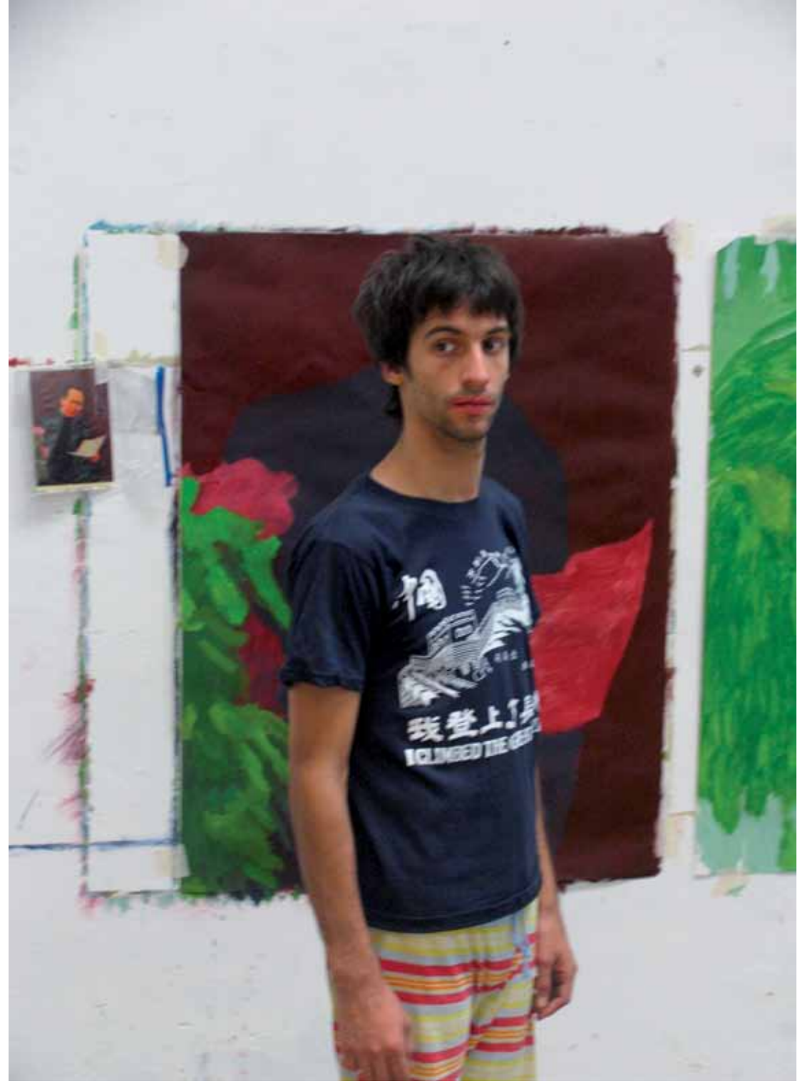
Texto y foto: Lorea Alfaro