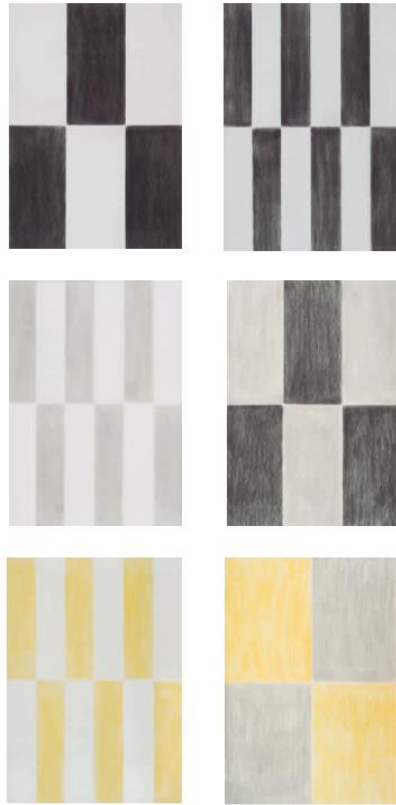
Sin título, 1997 Pastel sobre papel, 104 x 73 cm c/u