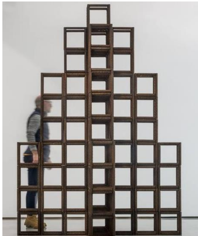
Aire armado I, 1993 Acero corrugado 250 x 175 x 175 cm